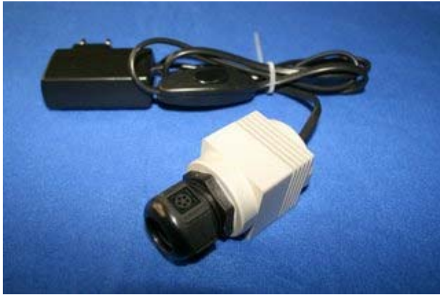
Illuminatore versione SINGLE

Ingombro e peso sono i parametri più critici di un illuminatore per fibre ottiche.